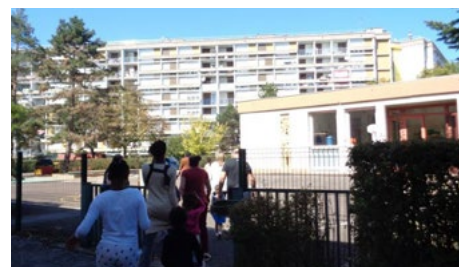
Au vu des critères socio-culturels de ce quartier Politique de la ville de Châlons-sur-Saône, les quatre écoles devraient être en REP.

dans l'école, « elle peut monter jusqu'à 22 élèves » qui rejoignent les autres élèves lors de séquences. L'école s'inquiète également pour son « Plus de maîtres », « Pourra-t-on le conserver ? » Résultat, le quartier s'est mobilisé, autour d'une intersyndicale dont le SNUipp-FSU est partie prenante et a mis en place des actions spécifiques. La demande est clairement, lors de la redéfinition de la carte en 2019, que les quatre écoles soient en EP. Sans réponses pour l'instant.